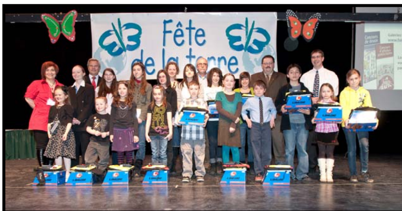
Lauréats des concours, Fête de la Terre des EVB-CSQ

La Fête de la Terre des Établissements verts Brundtland de la CSQ, organisée le jeudi 28 avril dernier et à laquelle la Fondation collabore étroitement, a permis de récompenser les lauréats des concours niveaux primaire, secondaire et collégial. L'émission Salut bonjour était présente à la fête pour la réalisation d'un reportage inspirant sur l'implication de ces jeunes sur la question des transports alternatifs. Cliquez ici pour visionner ce reportage. Vous pouvez également le retrouver à partir du site de la Fondation. Les œuvres lauréates de ces concours sont affichées dans 300 autobus du Réseau de transport de la Capitale et de la Société de transport de Lévis, et ce, jusqu'à la mi-juin. Peut-être les avez-vous déjà aperçues ?