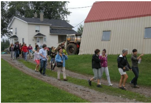
Visite du projet agroenvironnemental de la Rivière aux Pommes.

Près de 30 personnes, actuellement en formation en éducation ou déjà actives en éducation au développement durable, ont assisté à l'École d'été en éducation et développement durable, tenue du 13 au 17 août.