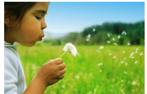
La Fondation développe un projet d'éveil à la nature pour les tout-petits.

On se questionne de plus en plus au Québec sur les impacts de la baisse de fréquentation et d'intérêt envers la nature sur la santé et le développement général des jeunes. Plusieurs études rigoureuses démontrent ces impacts. De concert avec la Fédération des intervenantes en petite enfance du Québec (FIPEQ), la Fondation a confié un mandat de sondage en ligne à l'agence Léger Marketing afin de connaître l'opinion des intervenantes sur cette question ainsi que leur intérêt à ce que la Fondation développe un recueil d'activités ainsi que des formations sur ce sujet. Les résultats préliminaires tendent à démontrer l'intérêt des éducateurs et éducatrices ainsi que le besoin d'éveiller les plus jeunes à la nature les entourant.